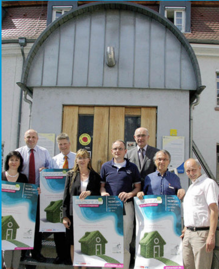
Gebäudeenergiemesse, Organisatoren und Sponsoren

Stadtverwaltung und die Interessengemeinschaft Greentec planen für den 16. Oktober eine Gebäudeenergiemesse in der Steinhalle.